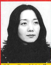
ロミー・フォークトレンダー