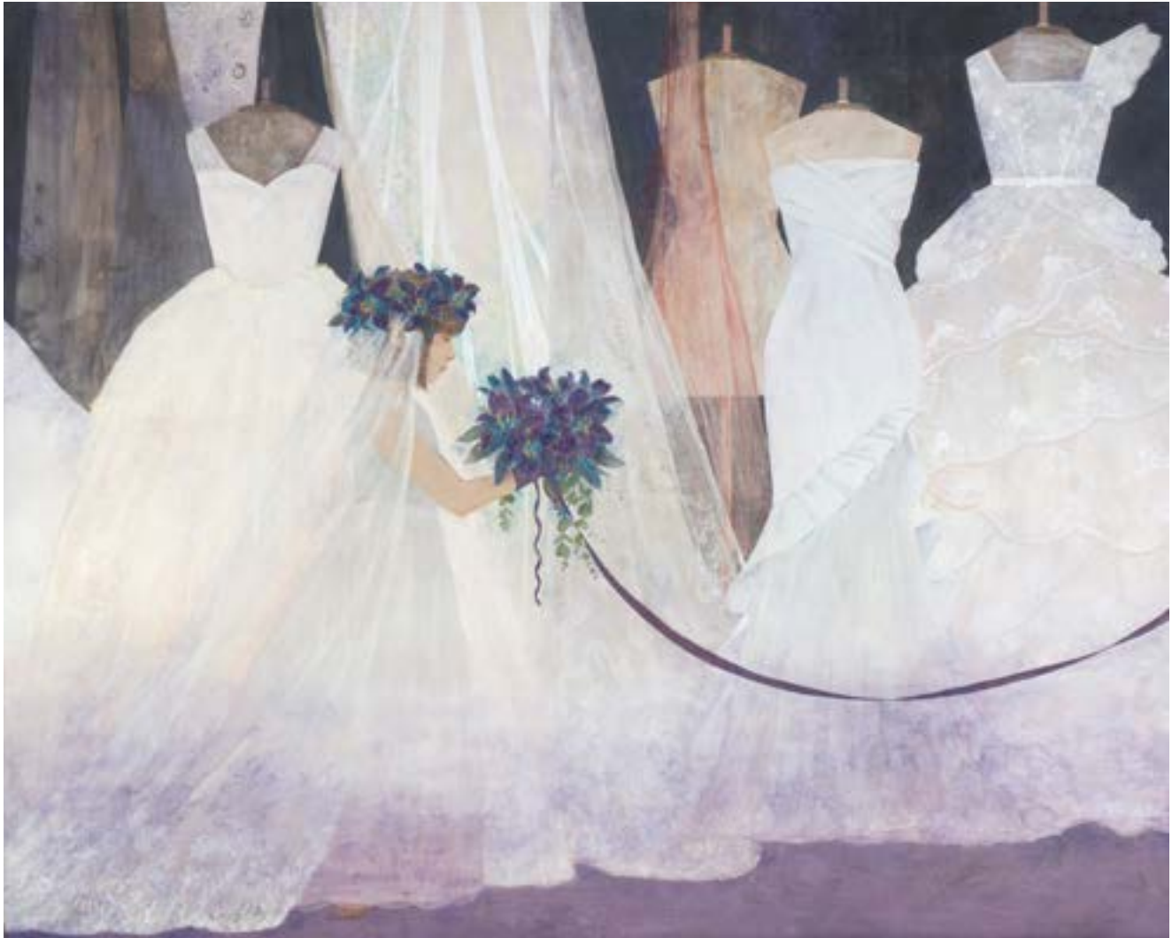
杉本 祐菜 SUGIMOTO Yuna