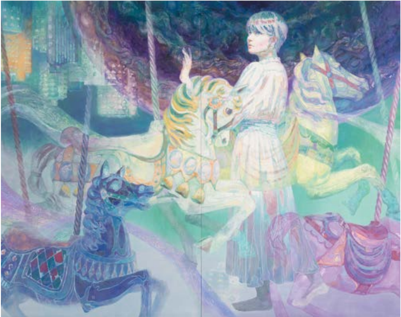
奥川夏妃 OKUKAWA Natsuki