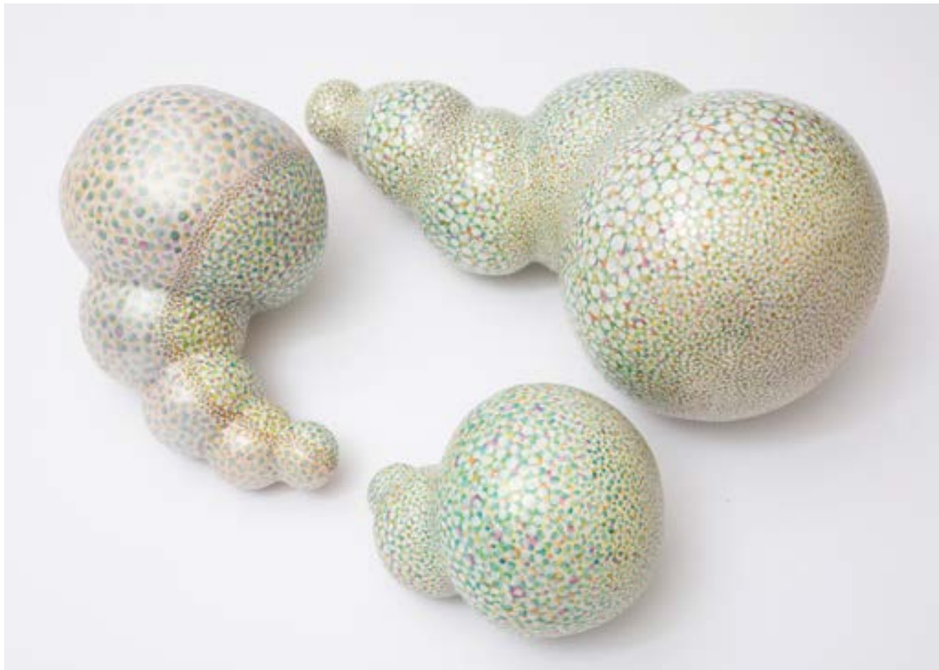
星妍 XING Yan